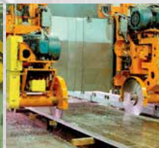
Резка круглых слитков